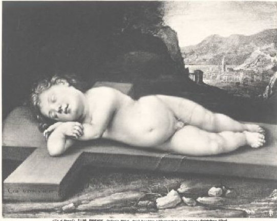
(Ca. 1890) F. BOCCHIA - ITALIA, UFFIZI - Qui il bambino addormentato sulla roccia; Cristofano Allori.